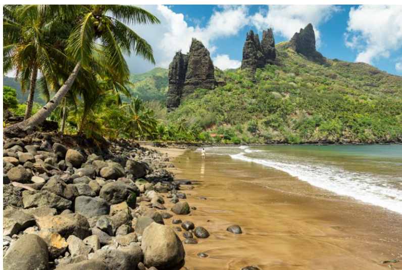
Nuku Hiva

Nella storia più contemporanea delle isole due grandi artisti come il pittore Paul Gauguin e il cantautore francese Jacques Brel si fecero conquistare dal fascino dell'isola di Hiva Oa, richiamati proprio dal Mana dell'isola, e trascorsero l'ultimo periodo della propria vita proprio qui, dove oggi sono sepolti. A Gauguin, che rese l'isola famosa in Europa attraverso i suoi numerosi dipinti dei paesaggi e delle donne del posto, è dedicato un centro culturale, ricostruzione della casa dell'artista, mentre Jacques Brel viene ricordato con una mostra fotografica.