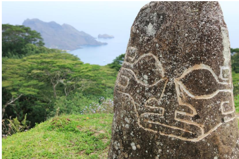
Nuku Hiva

Le isole Marchesi sono infatti un'importante testimonianza di un'antica civiltà giunta qui via mare intorno al 1000 DC e che ha visto il suo sviluppo tra il X ed il XIX secolo. Ancora oggi le isole presentano diversi elementi di grande valore per la cultura polinesiana, dalle sculture in pietra vulcanica emblema della cultura polinesiana, i “ tiki ”, come quelli di Taaoa sull'isola di Hiva Oa o quelli nella valle di Hatiheu sull'isola di Nuku Hiva, a veri e propri siti archeologici come quello di Upeke (Hiva Oa), Kamuihei (Nuku Hiva) o Tohua Manuia (Ua Pou).