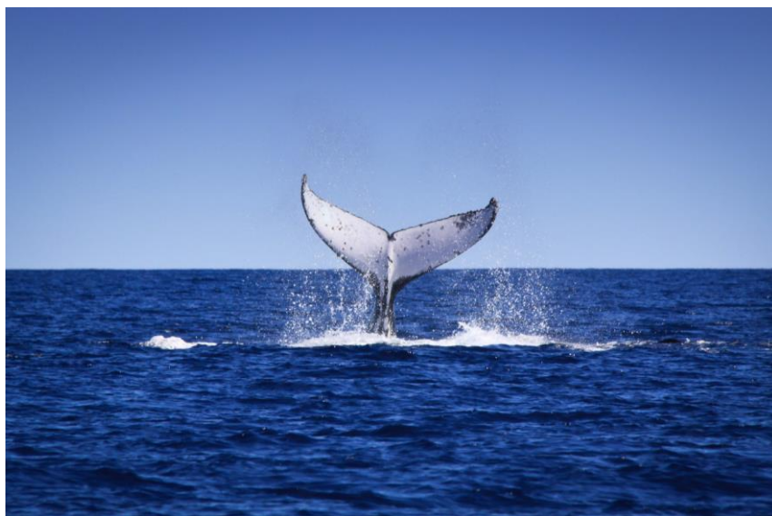
Megattera, Dampier Archipelago

Nelle acque remote del North West, l'esperienza diventa epica. Le baie del Pilbara, con alcuni highlight principali nelle isole Mackerel, Dampier, Point Samson e Port Hedland , accolgono le megattere durante il loro viaggio verso le nursery. La destinazione finale della migrazione di molte megattere si trova poi nel Kimberley: il vero spettacolo si trova nel Camden Sound Marine Park , la più importante nursery di megattere dell'emisfero sud, dove i piccoli giocano tra le onde mentre le madri li vegliano attentamente. Anche Broome offre avvistamenti memorabili: crociere pomeridiane o al tramonto permettono di incontrare balene e delfini snubfin in un contesto naturale ancora selvaggio e incontaminato.