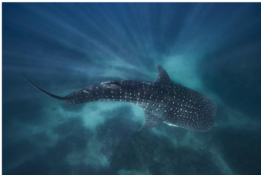
Squalo balena nel Ningaloo Marine Park

La Coral Coast è poi particolarmente famosa per ospitare anche un altro gigante del mare: lo squalo balena , con il quale è possibile nuotare a pochi metri di distanza (necessari a garantire il benessere dell'animale), tra marzo e luglio.