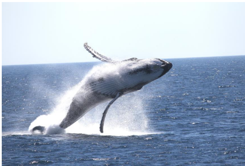
Megattera, costa di Perth

Vicino alla capitale, le avventure con le balene assumono sfumature diverse. Da marzo a maggio, le profondità del Perth Canyon ospitano le elusive balenottere azzurre , giganti silenziosi considerati gli animali più grandi del mondo, ma molto rari da avvistare. In questo periodo dell'anno sono occupate a nutrirsi di krill al largo della costa di Perth, mentre da settembre a novembre sono le megattere a risalire il profilo costiero, offrendo uno spettacolo di forza e grazia a pochi passi dalla città. Escursioni in barca da Fremantle o Hillarys, oppure una gita a Rottnest Island, permettono di osservare questi animali nel loro elemento naturale, con la sicurezza e l'esperienza di operatori esperti.